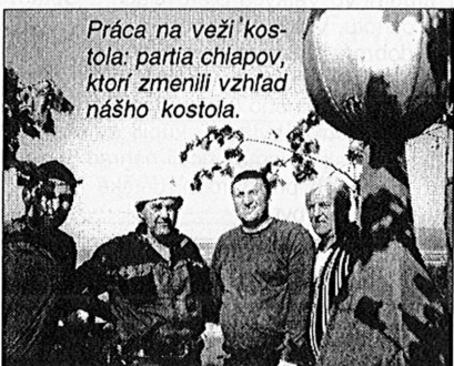
Práca na veži kostola: partia chlapov, ktorí zmenili vzhľad nášho kostola.