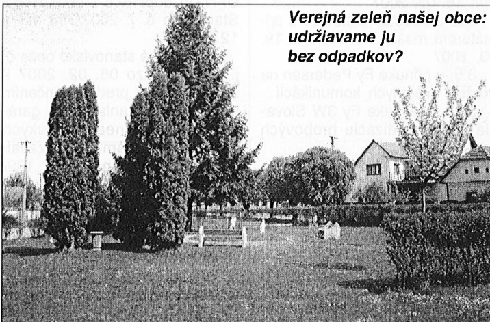
Verejná zeleň našej obce: udržiavame ju bez odpadkov?