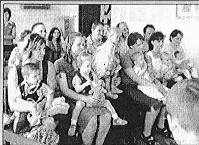
Človečik kričí. Aj, hľa svetlo sveta! Na nebi Boh mu zažal hviezdíčku. Neha a krása. Madona a dieťa.

Kúsky kurčata namáčame v cestíčku a poukladáme na vymastený pečáč. V horúcej rúre upečieme. Podávame so zemiakovou kašou a plátkami citróna alebo s dusenou ryžou, opekanými zemiakmi a so zeleninovým šalátom. Čas pečenia 25 – 30 min. MB