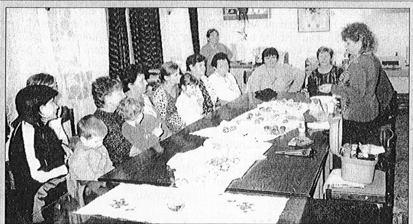
Maľovanie veľkonočných vajčiek: Stačí trochu chuti a ide to ....