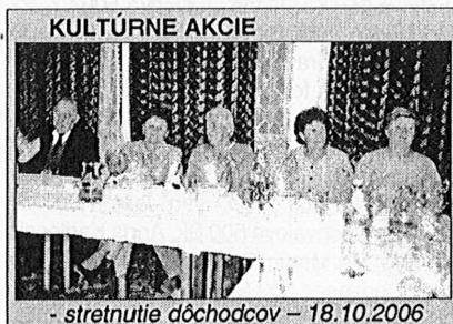
- stretnutie dôchodcov – 18.10.2006

Vedúcu školskej jedálne zastrešuje Obecný úrad ako zriaďovateľ našej Materskej školy.