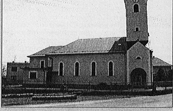
Nové okolie nášho kostola

500 g medu, 1/2 šálky vody, 250 g ražnej múky, 250 g pšeničnej múky, 100 g nadrobno pokrájaného citronátu môže byť i lyžička citronády/20 g medovníkového korenia, 20 g jedlej sódy. Takto sa to podarí: Med prevaríme a necháme vychladnúť. Ražnú i pšeničnú múku preosejeme na dosku, pridáme citronát, medovníkové korenie a s medovou vodou vymiesime na tuhé cesto. Nakoniec primiešame jedlú sódu, cesto zakryjeme a necháme 24 hodín odležať. Cesto rozvalkáme na hrúbku 5 mm, vykrojíme ozdoby a pečieme na vymastenom plechu v rúre predhriatej na 200° C.